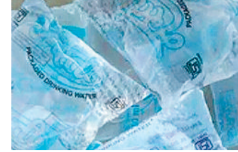
एजेसी नई दिल्ली

बोतल बंद पानी पर आई एक नई रिपोर्ट ने चौंकाने वाले खुलासे किए हैं। इससे इसकी गुणवत्ता और शुद्धता पर भरोसा संदेह के घेरे में आ गया है। हाल ही में भारतीय खाद्य सुरक्षा और मानक प्राधिकरण (एफएसएसआई) ने बोतल बंद पानी को 'उच्च जोखिम वाले खाद्य पदार्थ' की कैटेगरी में डाल दिया है। इसका मतलब है कि अब इस पानी के निर्माताओं को साल में कम से कम एक बार इसकी जांच जरूर करानी होगी। अभी तक कहा जाता था कि पिप्पा, बर्गर और मोमोज जैसे खाने वाले आइटम स्वास्थ्य के लिए ठीक नहीं हैं, लेकिन अब बोतल बंद पानी में मिलावट होने और स्वास्थ्य के लिए ठीक नहीं होने के खुलासे से गंभीर समस्या खड़ी हो गई है।