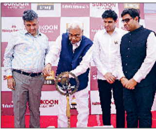
पहली बार रायपुर के किसी रेसिडेंशियल प्रोजेक्ट में मिनी वाटर पार्क की सुविधा

रायपुर। रहेजा ग्रुप ने अपने प्रीमियम रेसिडेंशियल प्लॉटिंग प्रोजेक्ट 'रहेजा निर्वाण' के तीसरे फेज का मल्ल शुभारंभ शुक्रवार को करना में किया। फेज 1 और 2 की अपार सफलता के बाद यह तीसरा फेज लांच किया गया है और इसमें कई नई सुविधाएं जोड़ी गई हैं। इस प्रोजेक्ट का प्रमुख आकर्षण यहां का मिनी वाटर पार्क है, जिसे विशेष रूप से बच्चों के लिए डिजाइन किया गया है। यह सुविधाएं रायपुर के किसी भी रेसिडेंशियल प्रोजेक्ट में पहली बार उपलब्ध कराई जा रही हैं।