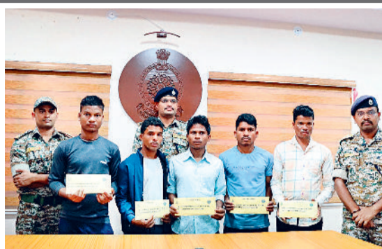
अब तक 189 नक्सलियों ने डाले हथियार

बीजापुर। जिले में चलाए जा रहे नक्सल उन्मूलन अभियान के तहत शुक्रवार को 11 लाख रुपये के इनामी सहित पांच नक्सलियों ने नक्सलवाद से तौबा करते हुए आत्मसमर्पण कर दिया है। इसके साथ ही इस वर्ष अब तक 189 नक्सलियों ने पुलिस के समक्ष आत्मसमर्पण किया है। वहीं विभिन्न घटनाओं में शामिल 473 नक्सलियों को गिरफ्तार किया गया है। बस्तर आईजी, डीआईजी दंतवाड़ा, सीआरपीएफ डीआईजी ऑफ व पुलिस अधीक्षक बीजापुर के निर्देश पर जिले में चलाए जा रहे नक्सल उन्मूलन अभियान के तहत डीआरजी, बस्तर फाइटर, कोबरा व सीआरपीएफ के संयुक्त प्रयासों से तथा सरकार की पुनर्वास व आत्मसमर्पण नीति तथा जिले में चलाए जा रहे नियत नेल्सनाय योजना से